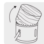
Ranura amplia para remover material fácilmente