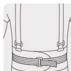
Cinturón de refuerzo central

*La cosmética del producto puede variar.