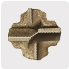
Punta de cruz