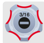
Marcado y código de color para fácil identificación de medida y punta