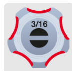
Marcado y código de color para fácil identificación de medida y punta