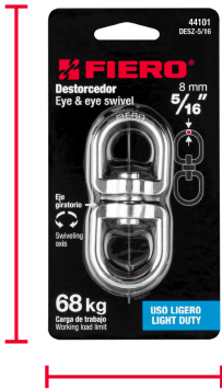
Largo 7 cm (3'')