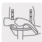
Gancho de acero para martillo