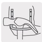
Gancho de acero para martillo