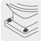
Para fijar la base del W.C. al piso