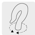
Ganchos de acero al cromo con giro de 360°