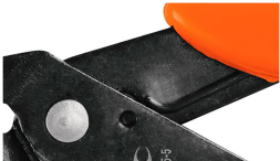
Resorte de autoapertura de fácil operación