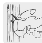
Tenaza para remover grapap