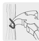
Uña para remover grapap