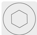
Entrada para llave allen