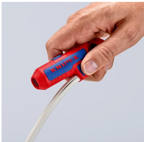
Con cuchilla cubierta en un apoyo para el pulgar de voladizo lateral para realizar cómodamente un corte longitudinal