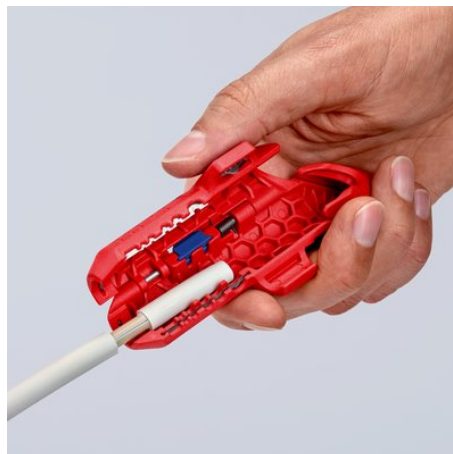
Pelar la cubierta exterior de un cable NYM