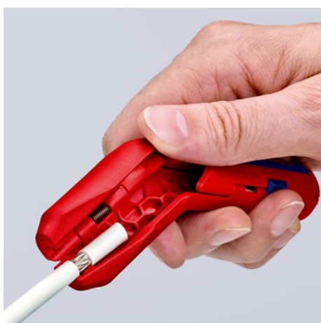
Pelar la cubierta exterior de un cable coaxial