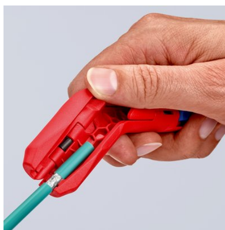
Pelar la cubierta exterior de un cable de datos