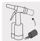
Recolector de vástagos